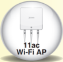
11ac Wi-Fi AP